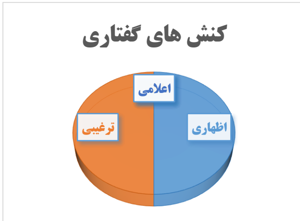
نمودار فراوانی انواع کنش گفتارها در استنادات قرآنی